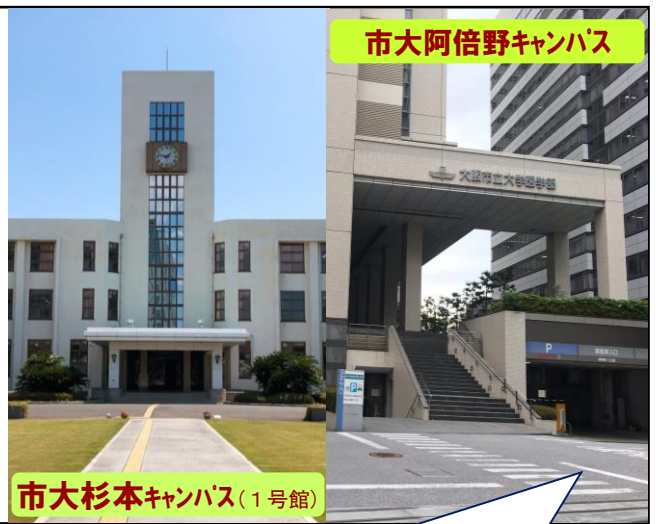
市大阿倍野キャンパス